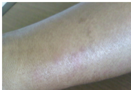
Gambar 1a. Lesi lengan kanan bawah sebelum terapi prednison

Berdasarkan anamnesis dan pemeriksaan fisik, ditegakkan diagnosis reaksi reversal pada release from treatment Morbus Hansen tipe MB. Pasien diterapi dengan prednison selama 12 minggu dengan dosis 40 mg/hari (dosis tunggal) selama 2 minggu pertama, dilanjutkan dengan 30 mg/hari, 20 mg/hari, 15 mg/hari, 10 mg/hari, dan 5 mg/hari setiap 2 minggu berikutnya. Pasien juga di edukasi untuk mengistirahatkan tangan kanannya. Dalam pemantauan, kondisi pasien membaik. Infiltrat eritematosa lengan kanan bawah sudah tidak ditemukan ( Gambar 1b ). Clawing pada jari manis dan kelingking tangan kanan sudah tidak terlihat dan fungsi motorik membaik ( Gambar 2c, 2d ). Tidak ditemukan lagi anestesi-hipestesi.