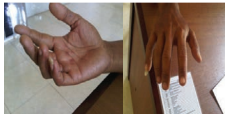
Gambar 2a. Clawing pada digiti IV-V manus dekstra disertai dengan gangguan fungsi motorik