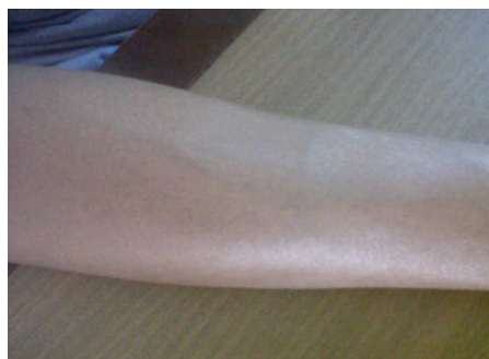
Gambar 1b. Kondisi lengan kanan bawah pada akhir terapi prednison